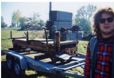
Die Führerstandsseite des Triebwagens