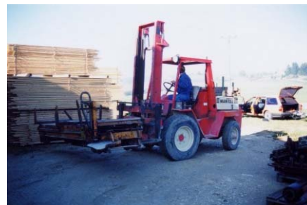
Verladen des Wagens per Gabelstapler