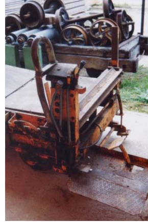
Ansicht des Führerstandes