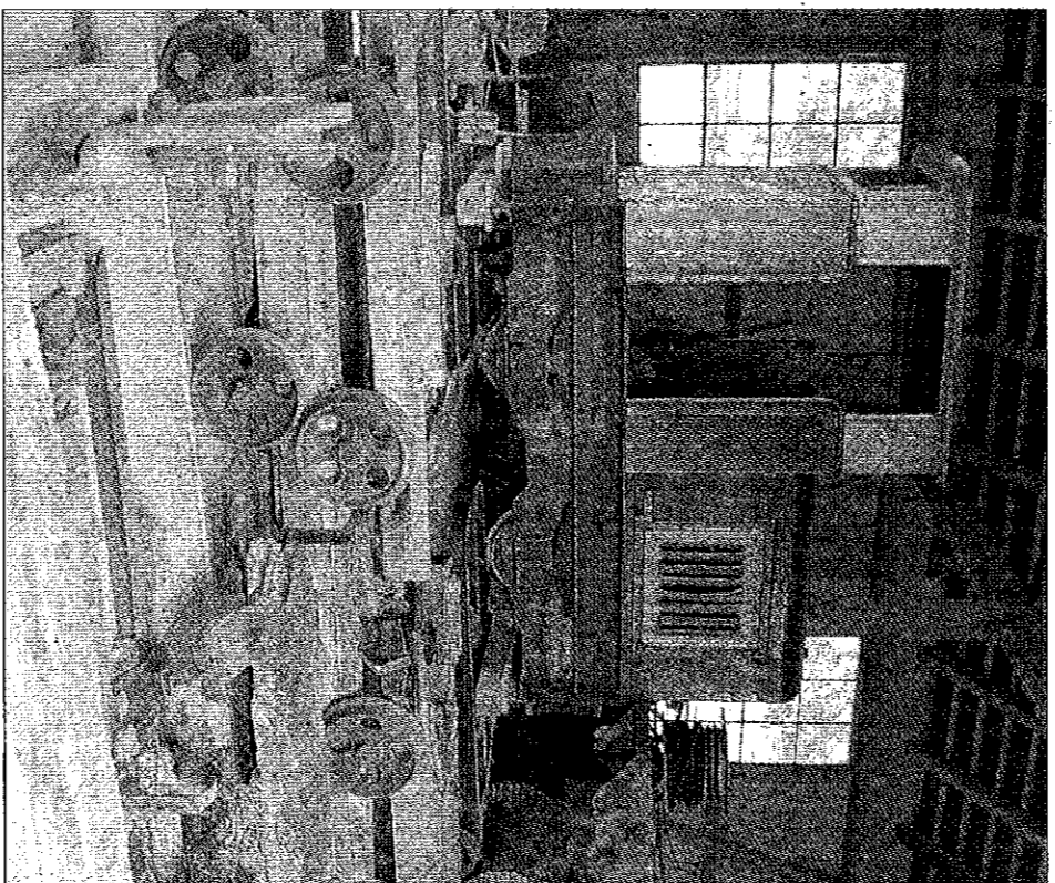
Detektorarbeit und Archäologie: Die bunte Gmeinder-Lok im Hintergrund stöberten die Sammler nach umfangreicher Recherche auf einem Spielplatz auf, die Fahrgestelle beziehungsweise deren Überreste (im Vordergrund) wurden bei Regensburg ausgegraben – sie waren verschüttet gewesen.

Höchste Zeit wurde es deshalb, dass nun auch die letzten noch fehlenden Stücke mit Hilfe von Gönnern aus der Fuhrbranche in den nördlichen Kreis Ansbach transportiert werden können.